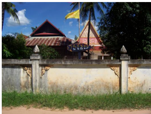
ภาพที่ 1 สภาพหมู่บ้านและวัดบ้านวังอ้อ ตำบลหัวดอน อำเภอเมืองใน จังหวัดอุบลราชธานี

อยู่ห่างจากบ้านวังอ้อลงมาประมาณ 1.8 กิโลเมตร มีบ้านวังถ้ำ หมู่ที่ 8 ซึ่งตั้งอยู่ติดกับชายป่าดงใหญ่ เป็นหมู่บ้านขนาดเล็ก มี 45 ครัวเรือน มีอายุการก่อตั้งมาแล้ว 94 ปี มีประชากรทั้งหมด 211 คน เป็นชาย 104 คน และหญิง 107 คน ทั้งบ้านวังอ้อและบ้านวังถ้ำ มีสภาพทั้งทางธรรมชาติ สังคม และวัฒนธรรมคล้ายคลึงกัน เป็นหมู่บ้านที่มีความสัมพันธ์เสมือนหนึ่งเป็นหมู่บ้านเดียวกัน จึงมักจะเรียกรวม ๆ กันว่า บ้านวังอ้อ-วังถ้ำ ควบคู่กันเสมอ สภาพพื้นที่ของบ้านวังอ้อวังถ้ำเป็นที่ราบลุ่มที่มีความอุดมสมบูรณ์