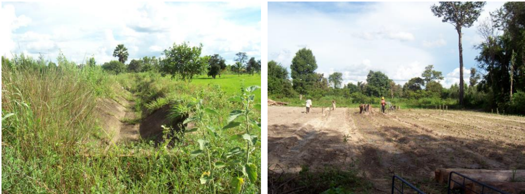
ภาพที่ 3 คลองส่งน้ำและพื้นที่เพาะปลูกทางการเกษตรของชาวบ้าน

เนื่องจากเป็นพื้นที่ที่อยู่ติดกับชายป่า และลำน้ำเซบาย และมีคลองส่งน้ำที่สูบน้ำด้วยพลังงานไฟฟ้าของกรมพลังงาน กระทรวงวิทยาศาสตร์ตัดผ่านพื้นที่การเกษตรของหมู่บ้านทั้ง 2 แห่งด้วย ในขณะเดียวกันก็มีพื้นที่ว่างเปล่าที่เป็นพื้นที่เนินชายป่าที่มีความอุดมสมบูรณ์ ซึ่งเหมาะแก่การเพาะปลูกพืชไร่ และเลี้ยงสัตว์อยู่เป็นจำนวนมาก จึงถือได้ว่าเป็นพื้นที่ที่มีความอุดมสมบูรณ์ทางธรรมชาติและวัฒนธรรม ซึ่งเป็นทุนทางธรรมชาติและทุนทางสังคมที่เป็นปัจจัยหนุนเสริมต่อการดำเนินงานของศูนย์ที่จะกล่าวถึงในลำดับต่อไป