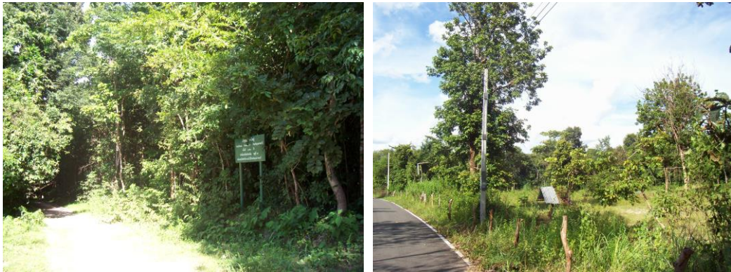
ภาพที่ 7 สภาพของป่าชุมชน

ชุมชนวังอ้อ-วังถ้ำ เป็นชุมชนชนบทที่มีความเป็นอยู่แบบวิถีพุทธ คือ อยู่แบบเรียบง่าย พึ่งพาอาศัยซึ่งกันและกัน เอื้ออาทรต่อกัน และพึ่งพาตนเองได้ มีความเชื่อและศรัทธาในพุทธศาสนา รักความสงบ ความยุติธรรม มุ่งมั่นในความดี มีความศรัทธาและยอมรับนับถือในความดี และผู้กระทำความดี มีความขยันหมั่นเพียรในการทำมาหาเลี้ยงชีพ มีความสามัคคีในหมู่คณะ ซึ่งเห็นได้จากการร่วมมือร่วมใจในการดำเนินกิจกรรมต่าง ๆ เพื่อส่วนรวม มีความรู้ความสามารถที่หลากหลาย เช่น การทอผ้า การจักสาน การเล่นกลองยาว จนเป็นที่ยอมรับกันทั่วไปในระดับท้องถิ่น ในขณะที่เดียวกันก็มีการประสานร่วมมือกันเป็นอย่างดีระหว่างบ้าน วัด โรงเรียน ในการหนุนเสริมและขับเคลื่อนกิจกรรมต่าง ๆ ที่เกิดขึ้นภายในชุมชน ซึ่งสภาพดังกล่าวนี้ถือว่าเป็นทุนทางสังคมที่สำคัญยิ่งที่ส่งผลต่อการเกิดขึ้น ดำรงอยู่ และประสบความสำเร็จของศูนย์ในปัจจุบัน