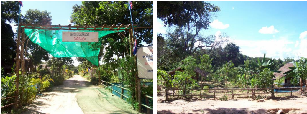
ภาพที่ 6 โครงการหมู่บ้านเปลี่ยนวิถีกินคนดีสู่สังคม