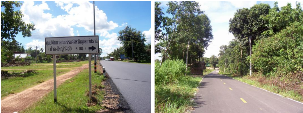
ภาพที่ 4 ป้ายบอกเส้นทางสู่ศูนย์พัฒนาธรรมป่าดงใหญ่ และสภาพภายนอกของป่าชุมชนดงใหญ่

บริเวณชายป่าชุมชนด้านทิศตะวันตกเป็นพื้นที่ป่าละเมาะ ซึ่งมีชาวบ้านครองครองอยู่ แต่มิได้ทำประโยชน์อะไร จำนวนประมาณ 18 ไร่ และเป็นพื้นที่ราบลาดเอียงลงมาติดกับลำน้ำเซบาย ซึ่งต่อมาเจ้าของพื้นที่บริเวณดังกล่าวได้บริจาคให้เป็นที่ตั้งของศูนย์รวมพื้นที่ 16 ไร่